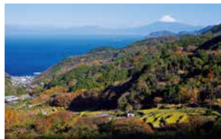
094 石部棚田 (静岡県松崎町)