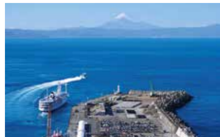
102 港の見える丘 (東京都大島町)

東京の南、120~290kmの太平洋に点在する伊豆諸島。新旧の溶岩による様々な火山地形、白砂と青い海の美しいコントラストなど、各島それぞれ特徴のある景観が楽しめます。