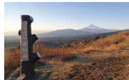
099 伊豆スカイライン滝知山展望台 (静岡県函南町・熱海市)