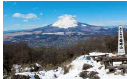
001 金時山 (神奈川県箱根町・南足柄市、静岡県小山町)

東海道の宿場町として古くから多くの旅人が行き来した箱根。芦ノ湖や仙石原、現在も噴気現象がみられる大涌谷など優れた景観を有し、多くの温泉にも恵まれることから、年間を通じて多くの観光客で賑わっています。