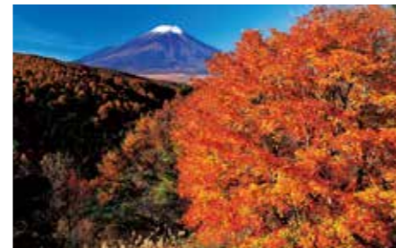
021 二十曲峠 (山梨県忍野村)