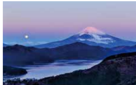
009 大観山展望台 (神奈川県箱根町・湯河原町)