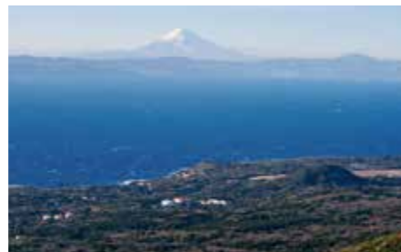
104 三原山山頂展望台 (東京都大島町)