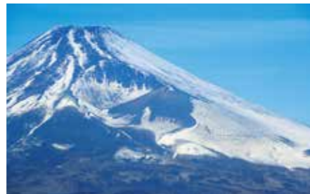
085 越前岳富士見台 (静岡県裾野市・富士市)