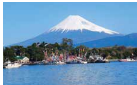
057 大瀬崎 (静岡県沼津市)

南洋にあった島や海底火山がフィリピン海プレートに乗って北上し、本州に衝突して誕生した伊豆半島。変化に富んだ海岸線、なだらかな天城連山などの地質資源が評価され、2018(平成30)年4月にユネスコ世界ジオパークに認定されました。