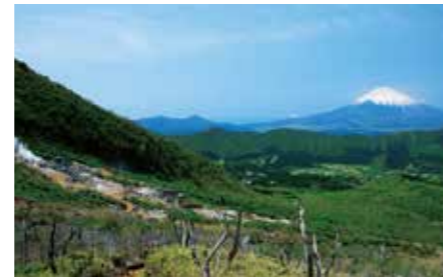
004 大涌谷 (神奈川県箱根町)