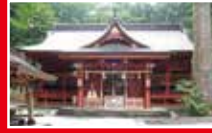
富士山東口本宮 富士浅間神社