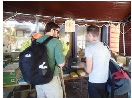
協力金ご協力ありがとうございます