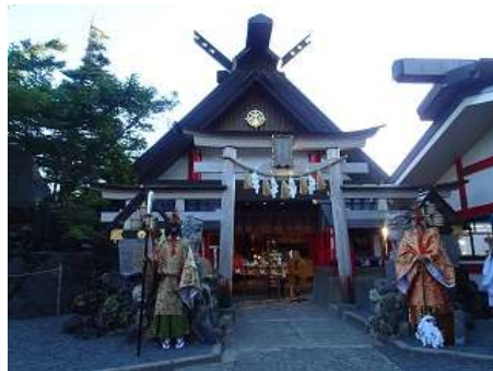
鳥居の前に立つ大天狗と小天狗

毎年参加する度に、富士山が古くから信仰の対象であり世界文化遺産であることを実感します。