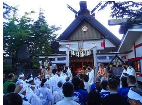
安全を祈願しました