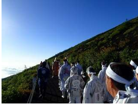
雲海を見ながら練り歩きました