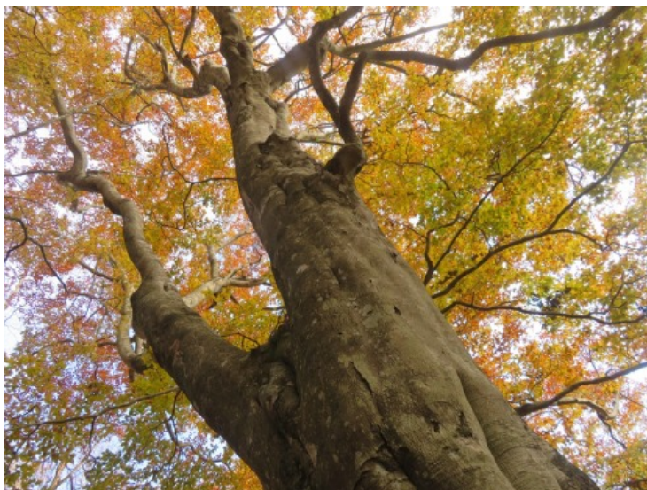
【秋の彩り】（11月 精進パノラマ台にて）