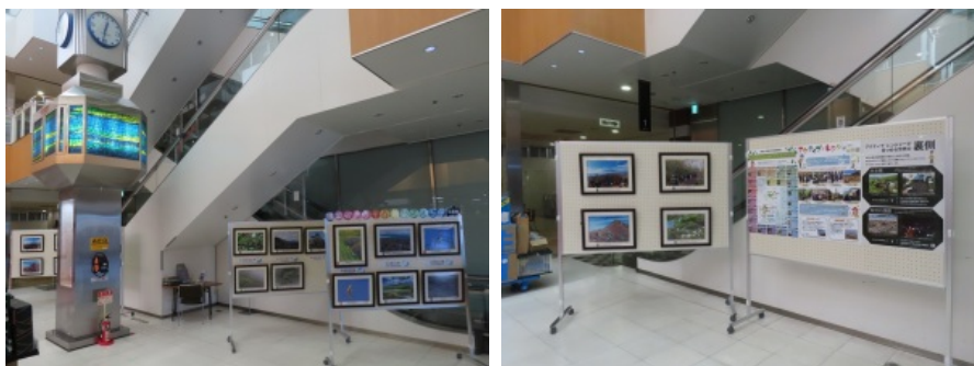
河口湖ショッピングセンターBELLにて開催しました 富士五湖の個別展示や国立公園の課題なども紹介した

▶ 令和6年度「アクティブ・レンジャー写真展(富士五湖)」開催 (11/8～21)