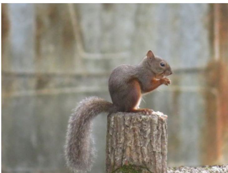
【私たちのすみかはどうなるの？】（10月 山中湖周辺にて）