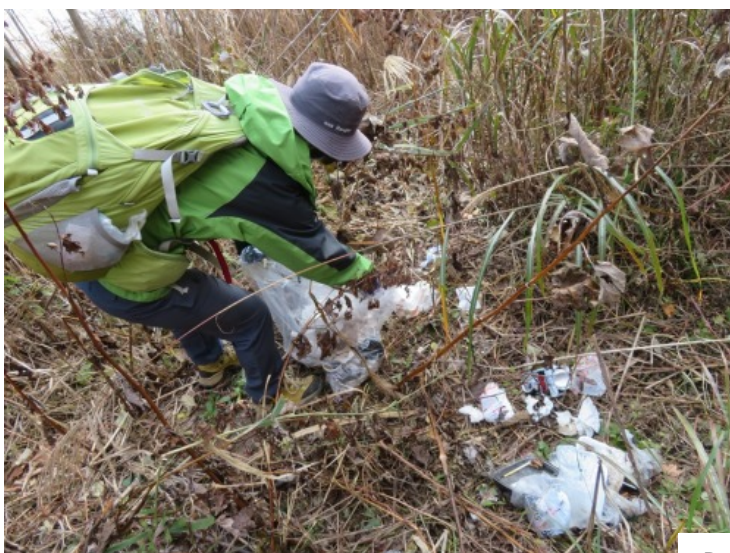
【マナーを守ってこそその自然の満喫】（11月 本栖湖畔にて）