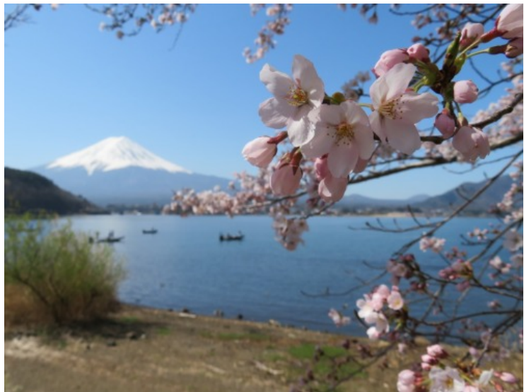
【春の息吹き】（4月 河口湖畔にて）