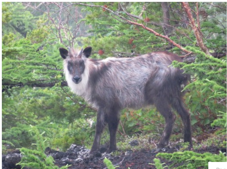
【あなたは何を見つめているの？】（7月 御庭にて）