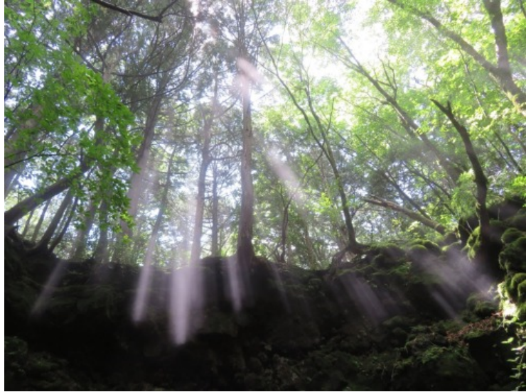
【大地の呼吸】（8月 富士風穴にて）