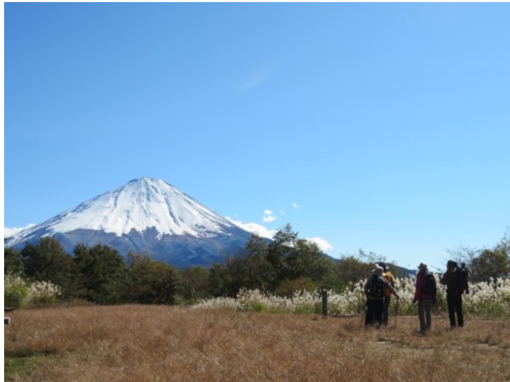
【さあ、出発だ】（10月 三湖台にて）